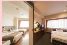
デラックストリプルフォース