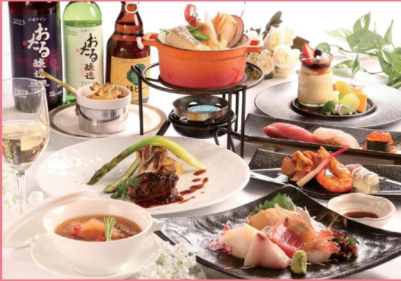
プライムディナーコース メニュー全8品