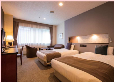
洋室ツインルーム

バリエーション豊かな客室タイプから、あなたにフィットする寛ぎの空間をお選びください。