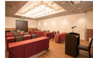
●スクールスタイル