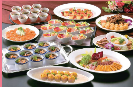
ナチュラルコース メニュー全9品