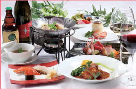
朝里川創作会席 メニュー全7品